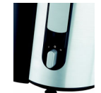
Variateur de vitesses